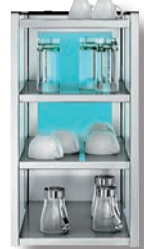
WMF 1500 S koppenwarmer