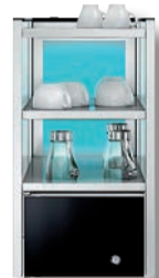
WMF 1500 S Cup&Cool