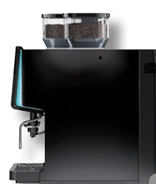
WMF 1500 S zijanzicht