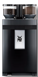
WMF 1500 S achterzijde